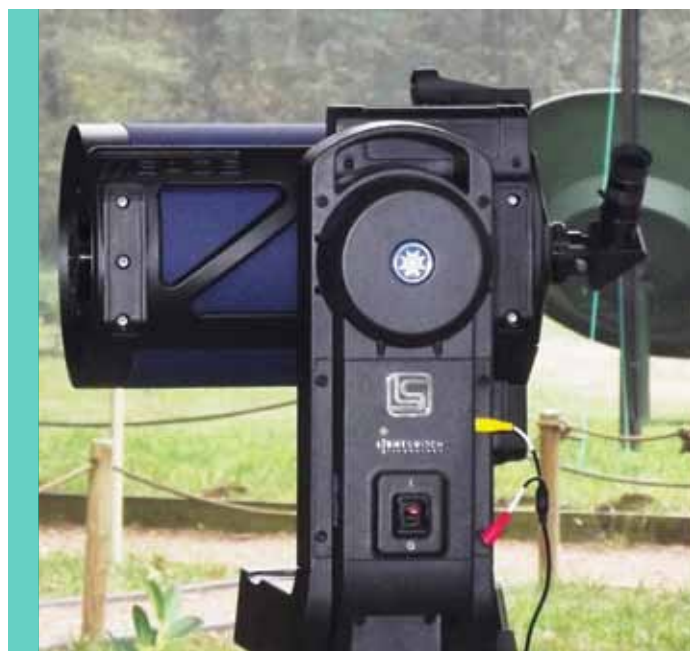
Il telescopio Meade ACF LS 8 è aggregato a una montatura monobraccio. Basta azionare un interruttore per disporre di uno strumento completamente automatizzato. Sullo sfondo si vede una parabola per radioastronomia dell'osservatorio FOAM13 di Tradate.

Tutto ciò è stato unito a sistemi ottici