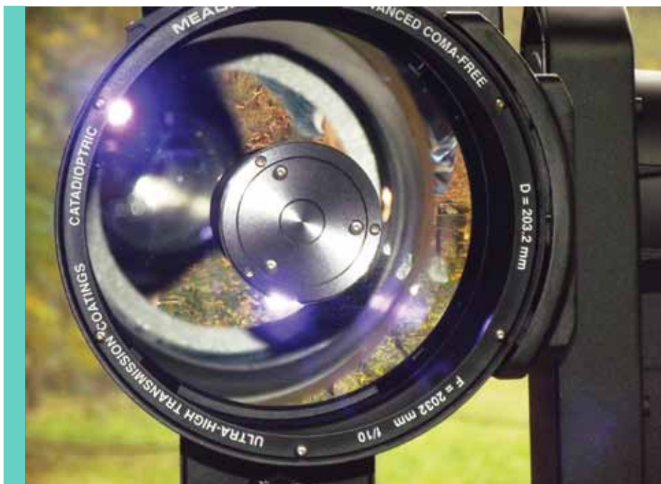
Tutte le ottiche Meade sono trattate con modalità UHTC che riflette o permette il transito fino al 99,8% della luce.

luminosità e di catturare anche gli ... ultimi fotoni per raggiungere magnitudini sempre più deboli. Insomma, a parità di ottiche, è come se gli strumenti trattati con l' Ultra-High Transmission Coatings avessero oltre 1 cm in più di diametro (per maggiori informazioni, si consiglia la lettura di www.meade.com/catalog/uhtc ).