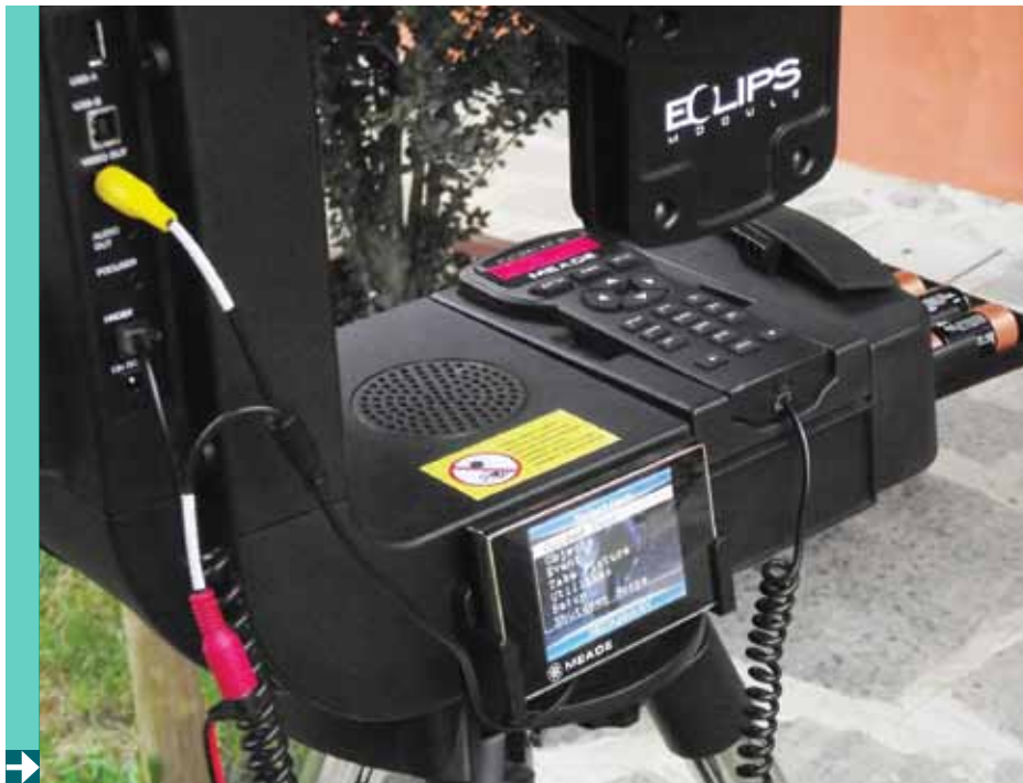
Il pacco di batterie che rendono lo strumento autosufficiente per una nottata osservativa è posto nella base della montatura. Qui si vedono anche l'altoparlante, il monitor LCD da 3,5" e il palmare Go To deposto nella sua sede. La camera CCD Eclips è visibile in alto.