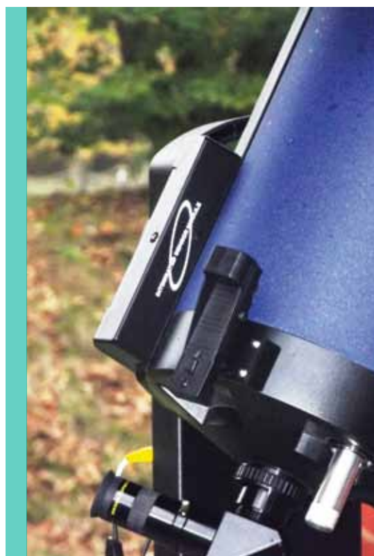
Il modulo GPS è ancorato lateralmente al tubo del telescopio e non ha mai dato prova di andare in fallo, comunicando costantemente con il computer interno; l'uso del pomolo di messa a fuoco introduce flessioni e vibrazioni, perché la forcella monobraccio appare "di misura" per il peso di questo telescopio.

vello, la direzione del nord e inizia, sempre automaticamente, a compiere l'allineamento con due stelle.