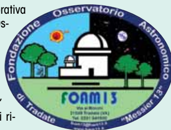
Il GdT dell'Osservatorio di Tradate

Il numero di test e di analisi effettuate dal GdT andrà aumentando con il tempo, per fornire una completa analisi ottico/meccanica degli strumenti in prova.