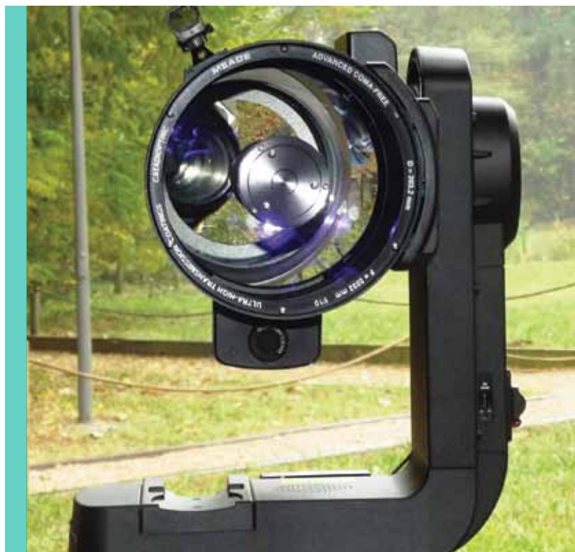
Lo strumento è collegato a un monobraccio comandato da motori passo passo e da un'elettronica di avanguardia. Qui è posizionato in modalità altazimutale, ma con alcuni semplici accessori lo si può disporre come equatoriale.