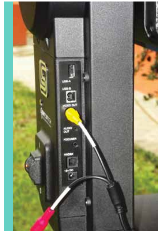
Sul montante del monobraccio sono ospitate tutte le connessioni che l'ACF LS 8" permette di eseguire. Il software può comandare anche il foccheggiatore.

viene raggiunta con la deposizione di strati multipli antiriflesso di ossido di alluminio ( Al_2O_3 ), di biossido di titanio ( TiO_2 ) e di fluoruro di magnesio ( MgF_2 ). Spesso ci si dimentica dell'importanza di questi trattamenti che, oltre a fare durare l'alluminatura delle ottiche nel tempo e per tanto tempo, permettono di guadagnare in